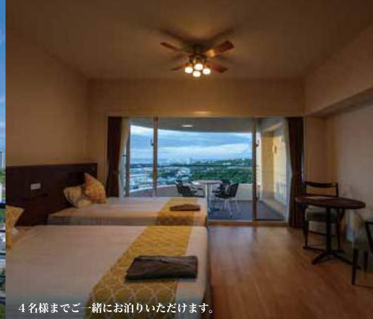
4名様まで一緒にお泊りいただけます。