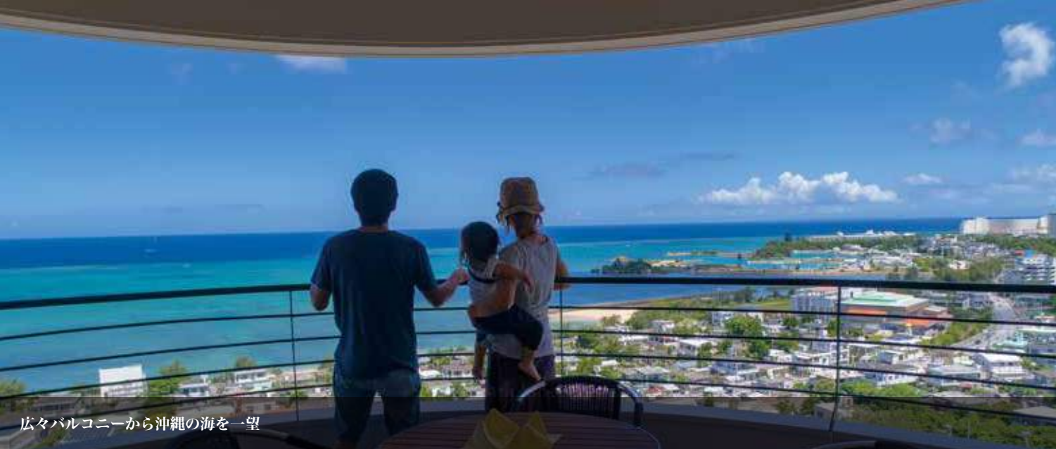
広々バルコニーから沖縄の海を一望