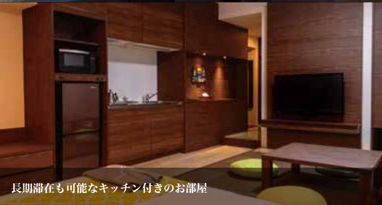
長期滞在も可能なキッチン付きのお部屋